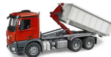
Camion trasporto materiale