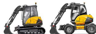
Escavatori, gommati o cingolati