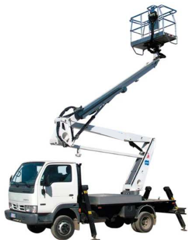
PLE (Piattaforme di Lavoro Elevabili)