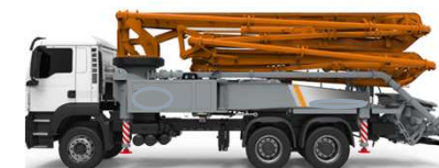
Auto-pompe per CLS